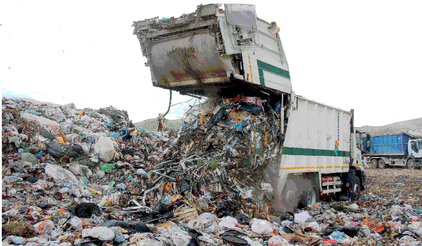
Discariche al collasso in quasi tutta la Sicilia che resta intrappolata dentro l'emergenza infinita dei rifiuti

➤ Cento milioni pronti da spendere entro l'anno, pena la perdita, fermi nei cassetti della Regione. Servirebbero a realizzare centri di raccolta e ad acquistare macchinari