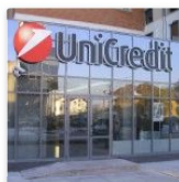
Agrigento. All'Itc Foderà incontro Unicredit su imprenditorialità giovanile