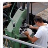
Agrigento. In crescita aziende in provincia