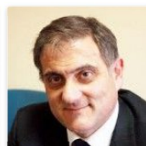
Abusivismo: Agrigento. Presidente Ars incontra sindaco di Licata per demolizioni abitazioni abusive