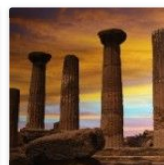
Agrigento. Una giornata dedicata alla Strada sdegli Scrittori